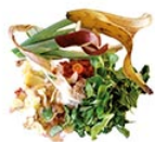
Fruits et légumes