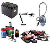
Piles, petits objets ménagers électriques ou électroniques