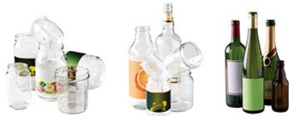
Bouteilles, pots, bocaux

En vrac, sans bouchon ni capsule ou couvercle. Uniquement entre 8h et 21h.