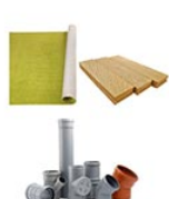
Rebuts de bricolage