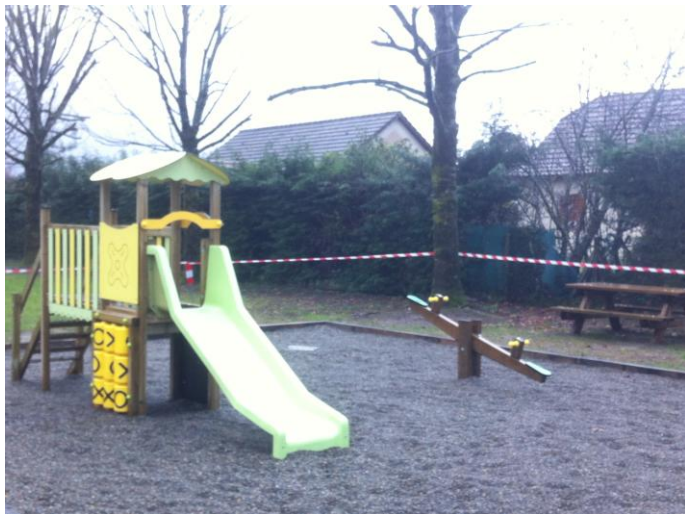
Aire de jeux en cours de construction en face de la Maison pour Tous.

Sur la pelouse de la parcelle 482, juste en face de la Maison pour Tous, les employés des services de la Mairie