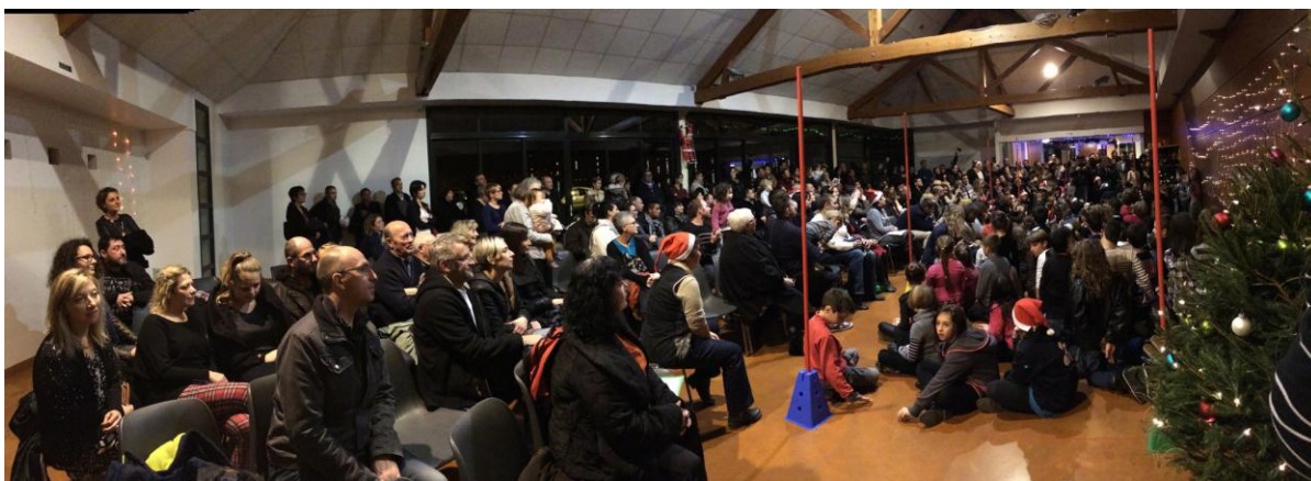
Salle comble pour cette belle fête de Noel.

Catherine Chevassut, pour le bureau http://asc-sirauss.e-monsite.com/ asc.sirauss@gmail.com