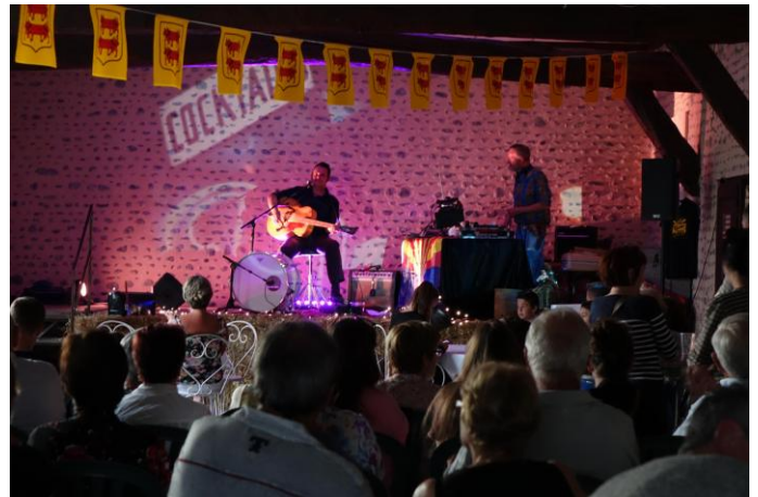
Concert Al Foul, Maison pour Tous à l'occasion de la fête de la musique.

Deux « temps forts » très réussis ont eu lieu durant l'année 2014.