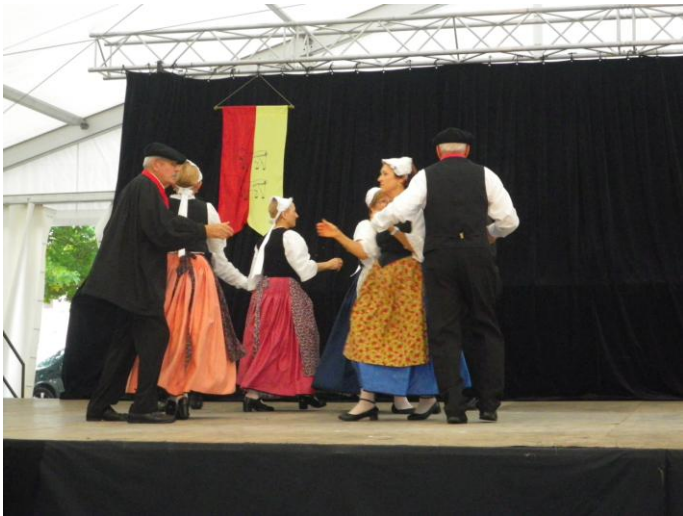
Danseurs le dimanche lors du repas-spectacle.

L'édition 2014 du Festival de la Culture béarnaise, que notre village accueille chaque année le dernier dimanche de septembre et les deux jours, qui le précèdent, a été un franc succès !