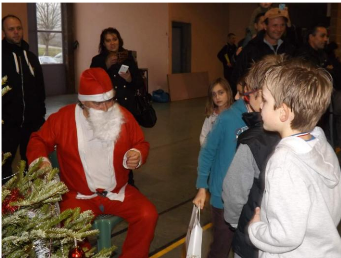
Le Père Noël lors de la remise des cadeaux aux enfants des écoles de football.