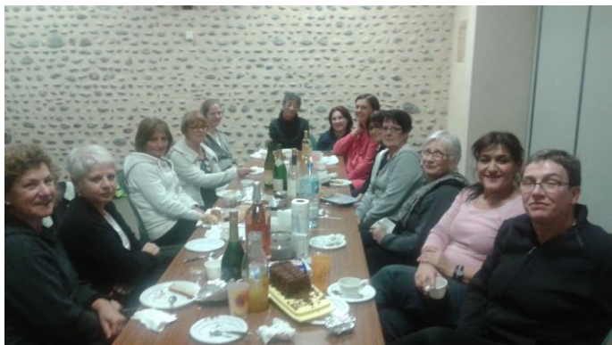
Repas de fin d'année gymnastique.

Voilà presque 4 mois que les cours de gym ont repris.