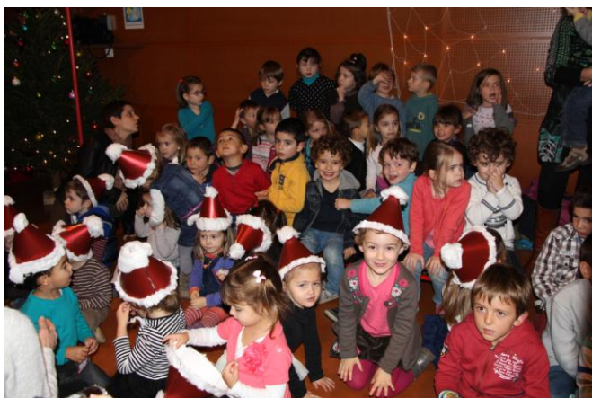
Spectacle de Noel des écoles.